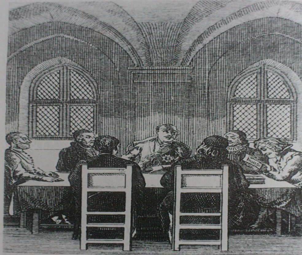
Religiöses Gespräch zu Thorn. S. Le Colloque de Thorn, 1645.