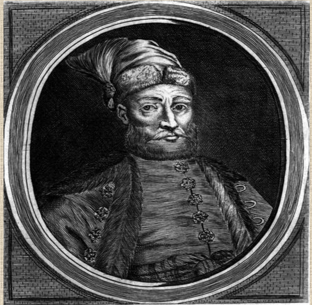
GIOVANNI DI LESZNO PALATINO DI POSNANIA. &c.

Legat zum Colloquium Charitativum, nach der Abberufung von Jerzy Ossolinski.